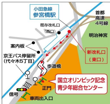
参宮橋からの[横断歩道]を使った経路